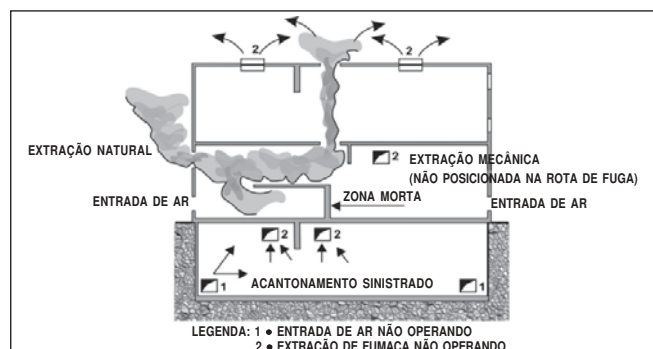
Figura 2: Zonas mortas