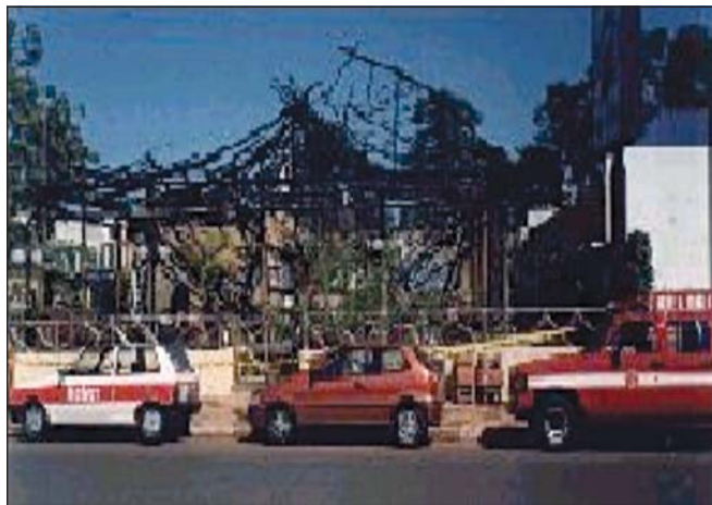
Figura 2: Incêndio em edificação com cobertura de fibras vegetais (ocupação de bar e restaurante)

5.5.4 Recomenda-se a utilização de sistemas de aspersão de água que visam a manter as fibras permanentemente úmidas ou destinadas ao próprio combate das chamas, sem prejuízo das demais medidas constantes desta IT.