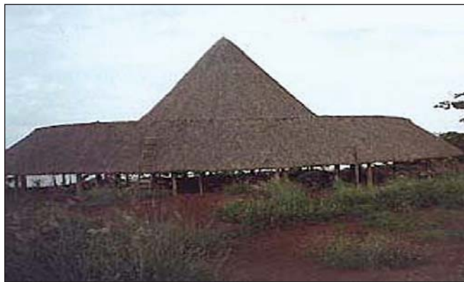
Figura 1: Edificação de madeira com cobertura de fibras vegetais

5.2.1 As fontes de calor que podem inflamar as fibras combustíveis devem ser isoladas e mantidas à distância, mínima, de 5 m.