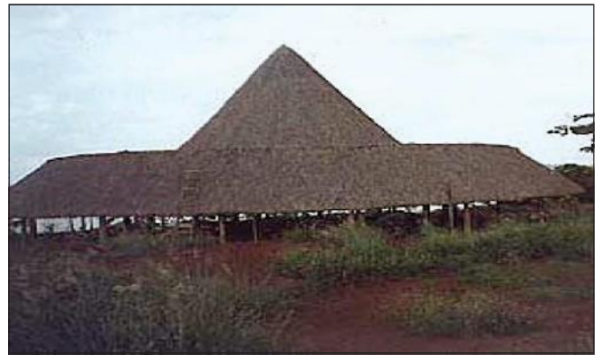
Edificação de madeira com cobertura de fibras vegetais

5.2.1 As fontes de calor que podem inflamar as fibras combustíveis devem ser isoladas e mantidas à distância, mínima, de 5 m.