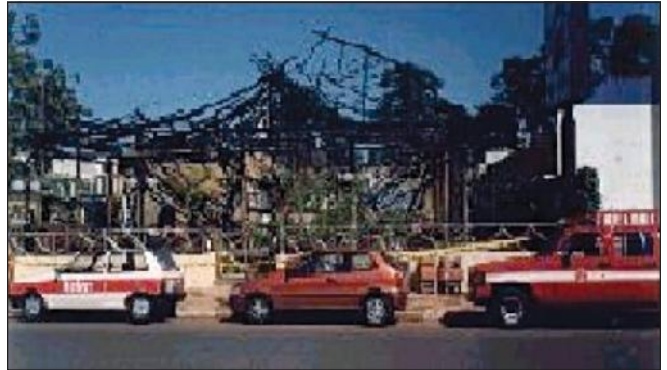
Incêndio em edificação com cobertura de fibras vegetais (ocupação de bar e restaurante)

5.5.4 Recomenda-se a utilização de sistemas de aspersão de água que visam a manter as fibras permanentemente úmidas ou destinadas ao próprio combate das chamas, sem prejuízo das demais medidas constantes desta IT.