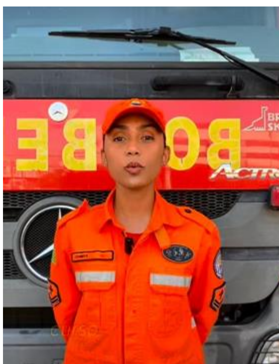
Início e conclusão do Curso de Aperfeiçoamento de Oficiais CAO PM - Especialização em Gestão de Segurança Pública, realizado através de convênio com a UESPI, o qual especializou 12 oficiais do Corpo de Bombeiros Militar do Estado do Piauí.