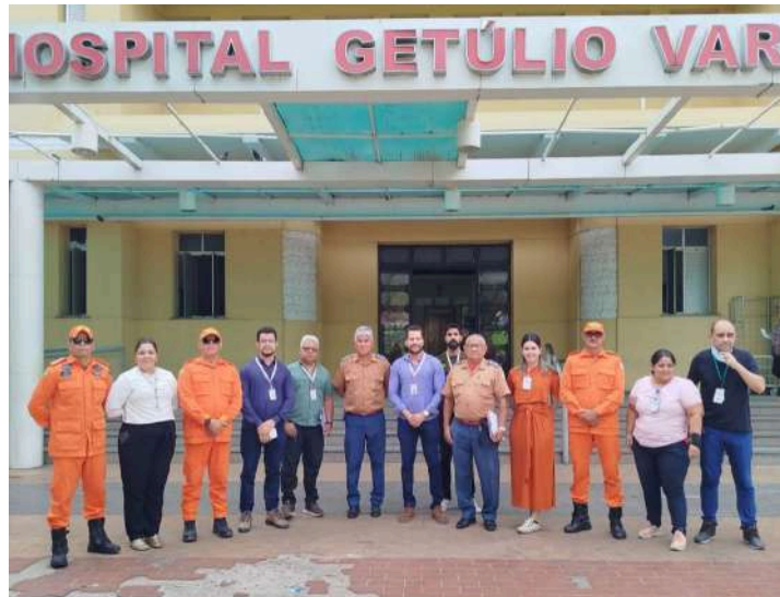
2.1.31 CBMEPI realiza aula inaugural do Curso de Formação de Soldados 2025