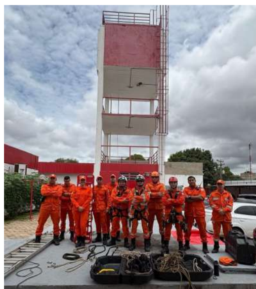
2.1.20 Formatura do CMAUT 2025 marca excelência dos militares do CBMEPI