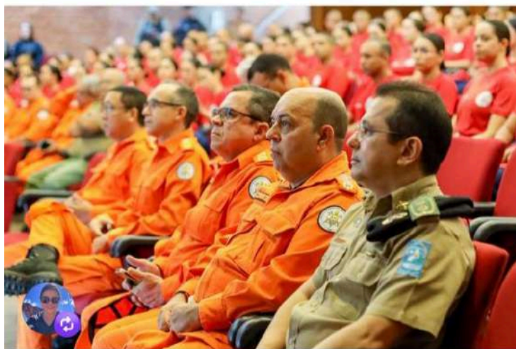
2.1.32 Assinada ordem de serviço para construção da 1ª unidade do CBMEPI no Cerrado Piauiense