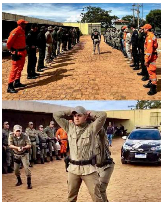
2.1.19 Rotina de treinamentos para salvar vidas